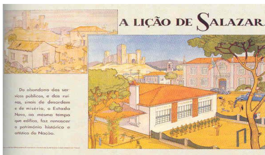
Figura I – Imagem ilustrativa da política salazarista na implementação dos novos ideais

de Direito da Universidade de Coimbra. António de Oliveira Salazar aceitou a pasta das Finanças, na condição de supervisionar o orçamento de todos os ministérios e ter direito de veto sobre todos os aumentos de despesa propostos. Os êxitos da sua política financeira permitiram-lhe arrecadar enorme prestígio, sendo cognominado “Salvador da Pátria” – pela primeira vez, em 1928-29 e desde há quinze anos, o saldo positivo orçamentado era concretizado, o que não deixava de constituir uma enorme vitória do rigor financeiro, da capacidade de gestão orçamental e da política de contenção das despesas imposta a todos os ministérios. Iniciava-se então a ascensão política daquele que iria marcar decisivamente a vida portuguesa durante quatro décadas, verdadeiro fundador do regime depois designado “Estado Novo”.