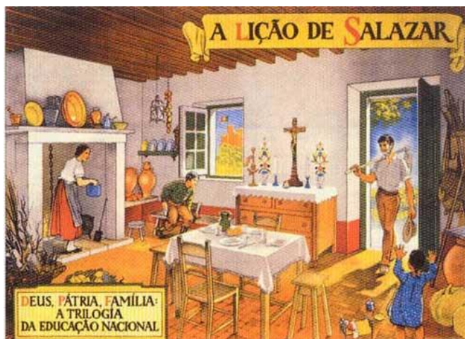
Figura II – Imagem ilustrativa da tríade “Deus, Pátria, Família

corporativo como forma de superar os antagonismos sociais, a luta de classes e garantir a necessária harmonização de interesses.