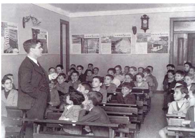
Figura III – Imagem ilustrativa da separação sexista promovida pela escolarização salazarista

“Os novos dirigentes consideravam de tal gravidade a presença de meninos e meninas nas mesmas salas de aula, tanto receavam de tamanha promiscuidade, mal se sentaram no poder (...), logo decretaram a separação dos sexos nas escolas primárias elementares” (Carvalho 1985). O ensino primário geral, que passou a ser designado “elementar”, continuou a ser obrigatório, mas reduzido em um ano; o superior, designado complementar, foi igualmente reduzido em um ano.