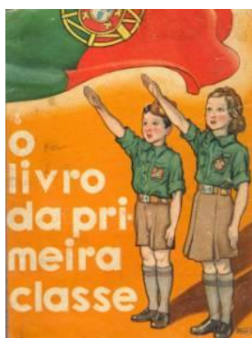
Figura IV e V – Exemplos de livros de leitura da época, invocando claramente ideais fundamentais da construção ideológica do salazarismo

O ano de 1936 constituiu um momento crucial na concretização do projecto de educação nacionalista. A mais importante de todas as reformas educativas empreendidas pelo Estado Novo teve a assinatura de António F. Carneiro Pacheco, nomeado Ministro da Instrução Pública em 18 de Janeiro de 1936. A Lei n.º 1 941, de 11 de Abril de 1936, promulgada pela Assembleia Nacional, remodelava o conjunto do sistema educativo e estabelecia os propósitos do regime expressando-os num conjunto de catorze “Bases”. Tratava-se de um diploma que procurava abranger todas as vertentes da organização do sistema educativo e patenteava propósitos claros de promover a absorção dos valores tão prezados ao regime salazarista: obediência, hierarquia, devoção à Pátria, espírito nacional, devoção cristã, organização corporativa.