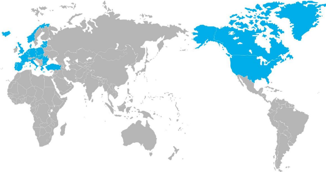
Mapa 1 – A Aliança Transatlântica no mundo geoeconómico

princípios deram origem à OTAN porque é que não podem originar a «Organização de Segurança Mundial»? E porque não o dia 4 de Abril de 2009 para oficializar esse acontecimento? lxx