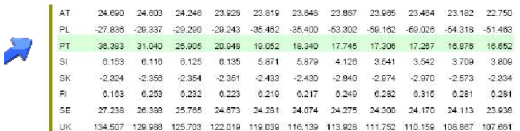
Tabela 1: Hipóteses sobre a evolução das migrações (2005 – 2015)